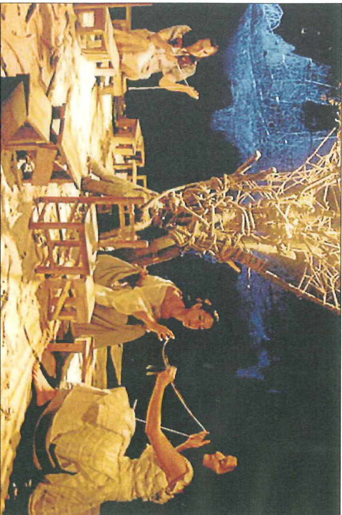
Smukke kvinder tilbyder tilskuerne livets råd - en scene fra »City Puzzle«. der: Udtæningen kan bruges som bogmærke. »City Puzzle« af Enrique Vargas (Republique, Østerbro, København - varighed ca. 1 time og 10 min. Opførelse til den 6. september) redaktionen@sf-medier.dk

Mange stags liv mødes i den forestilling, som åbner Københavns nye teater, Republique, i det tidligere Kanonhallen. Teatret bruger sit publikum bruge fantasien og sanserne og blive medskabere. »Uanset hvem du er, er vi sikre på, at du får det ud af din rejse, du skal have heder det overlegent og overbevisende i programkæringen, for teater er, hvad tilskueren gør det til. Som